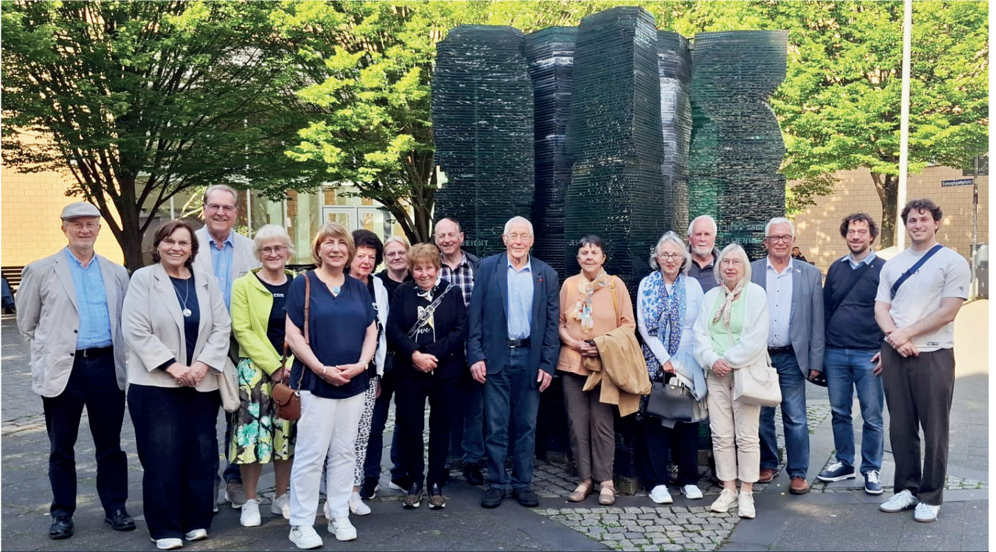
Mitglieder des EAK Kreis Heinsberg und Aachen, unterstützt von Mitgliedern der Senioren Union, besuchten die Neue Synagoge der jüdischen Gemeinde in Aachen.

Ein modernes Gebäude, großflächig verglast mit Panzerglas, erwartete uns. Es wurde am Ort der in 1862 erbauten und während der Novemberpogrome 1938 zerstörten alten Synagoge erbaut und am 18.05.1995 eingeweiht. Umfangreich und umfassend wurden wir über das Judentum informiert, unsere