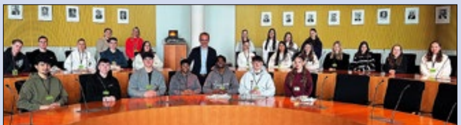
Die Schülerinnen und Schüler des Erkelenzer Cusanus-Gymnasiums waren vom Besuch des Bundestages begeistert und zeigten großes Interesse an der politischen Arbeit von Winfried Oellers.