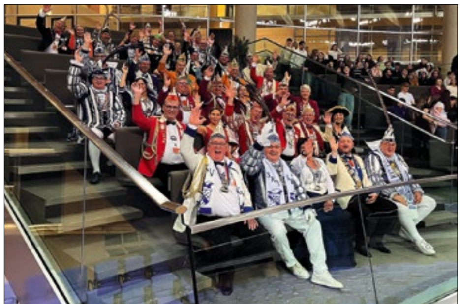
So stimmungsvoll geht es im Deutschen Bundestag nicht immer zu.

Im Ornat besichtigten sie die Räumlichkeiten des Bundestages. Ausschuss- und Fraktions-sitzungssaal gehörten ebenso dazu wie der Plenarsaal. In einem Besprechungsraum mit Blick auf den Bundestag brachten die „Kellerjungs“ die Karnevalisten zum Schunkeln. Damit war die karnevalistische Botschaft in Berlin angekommen.