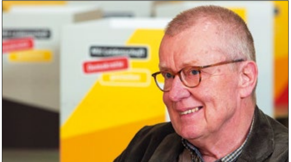
Ex-Generalsekretär Ruprecht Polenz kommt zur Klausurtagung nach Münster.

Polenz, 19 Jahre lang Bundestagsabgeordneter, ehemaliger Generalsekretär der Bundespartei und kenntnisreicher