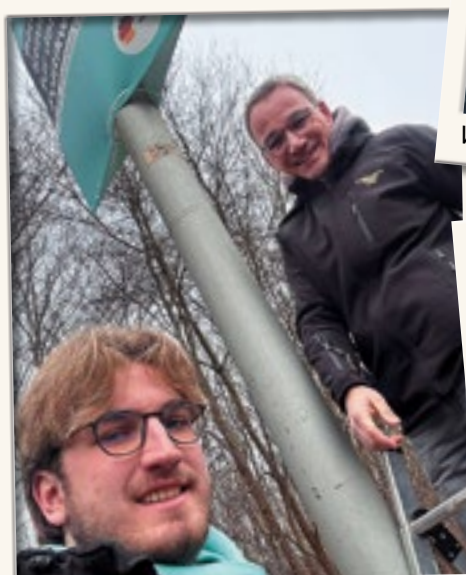
Plakate aufhängen im ganzen Kreis Heinsberg.