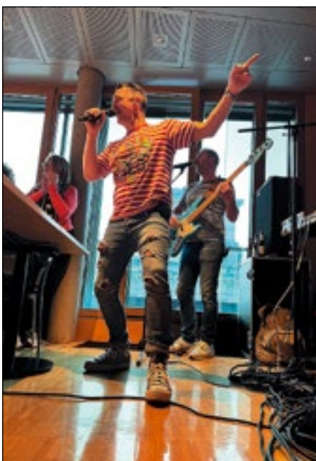
Eine klare karnevalistische Botschaft verkündeten die „Kellerjungs“ mit ihrer Musik.

Daneben erhielten die Karnevalisten u.a. durch die Besuche des Stasigefängnisses Hohenschönhausen, des Bundesrates und des Denkmals für die ermordeten Juden Europas auch viele weitere Einblicke in das historische und politische Berlin. Mit meiner Einladung sage ich ganz